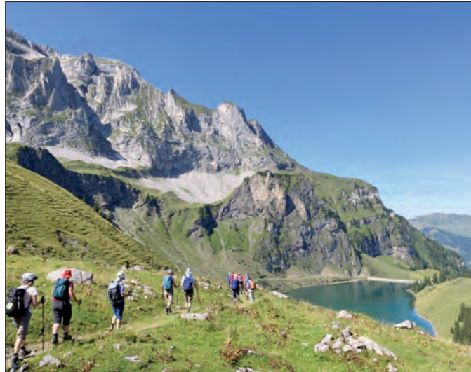
Abwechslungsreiche Wanderungen in herrlicher Landschaft gehören zu den Aktivitäten der Naturfreunde.

Das vereinseigene Naturfreundehaus Sunneschyn auf der Wäckerschwend wird für diverse Anlässe