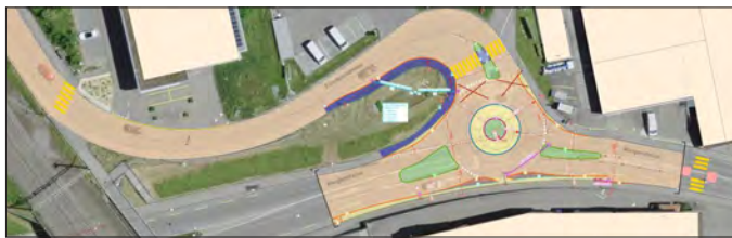
Situation Wangenstrasse / Eisenbahnstrasse.