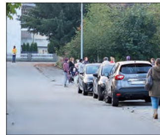
Elterntaxis am Rosenweg.