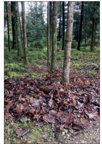
Garten- und Küchenabfälle, inklusiv Laub gehören nicht in den Wald: Neben Spritzmitteln können so Krankheiten und Neophyten in den Wald verschleppt werden.

windgeschützten und ungestörten Ort zu stehen kommen. Zuerst mit kreuzweise aufgeschichteten Ästen oder Holzscheiten einen Hohlraum bilden. Darüber das trockene Laub aufschichten und mit ein paar