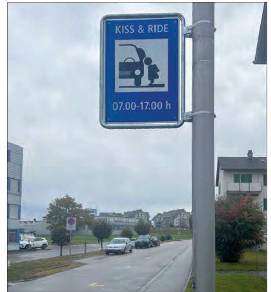
Für Elterntaxis sind neu am Kappeliweg (Bild) und an der Oberfeldstrasse Kiss & Ride-Zonen signalisiert, wo die Kinder ein- und aussteigen können.

bahn gekennzeichnet. Dort ist das kurze Anhalten zwischen 7 und 17 Uhr gestattet. Zur Einhaltung der Verkehrsregelung werden in den beiden betroffenen Quartieren unregelmässige Kontrollen durch-