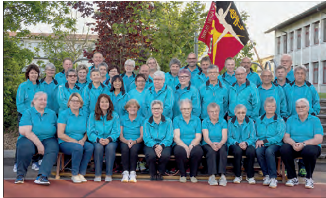
Der Sportverein Herzogenbuchsee, früher SATUS Sportverein, feierte sein 100-jähriges Bestehen.